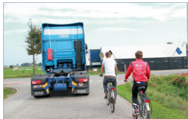
Rechts achter een groot voertuig blijven is het veiligste.