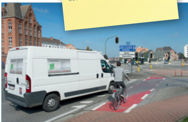
Naast een groot voertuig fietsen is gevaarlijk.

Een vrachtwagen heeft een lange remafstand. Bij een snelheid van 50 km/uur heeft hij 35 m nodig om tot stilstand te komen.