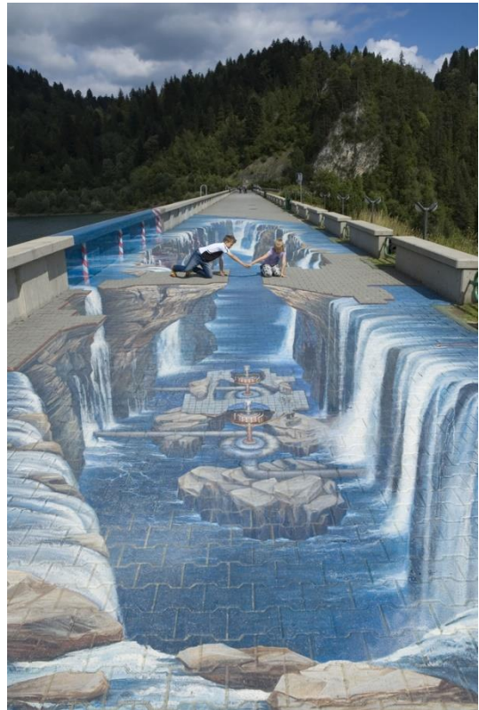
Figuur 1: Op deze tekening zie je een kunstwerk van een stoepkunstenaar. Zitten de kinderen op een brug over een waterval of is het slechts gezichtsbedrog?