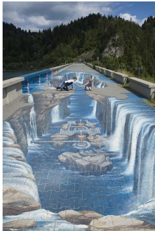
Figuur 1: Op deze tekening zie je een kunstwerk van een stoepkunstenaar. Zitten de kinderen op een brug over een waterval of is het slechts gezichtsbedrog?