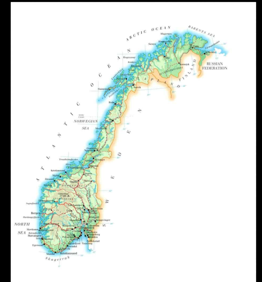
De familie kwam uit Noorwegen en ging er jaarlijks op vakantie