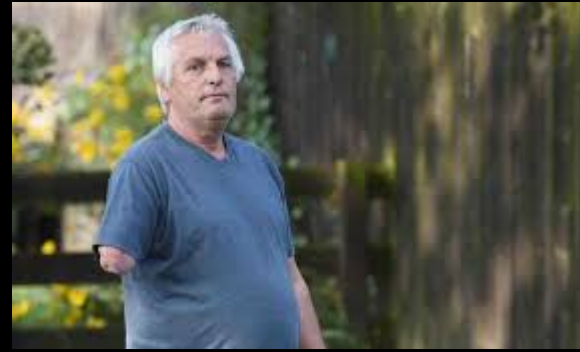
Papa had maar een arm